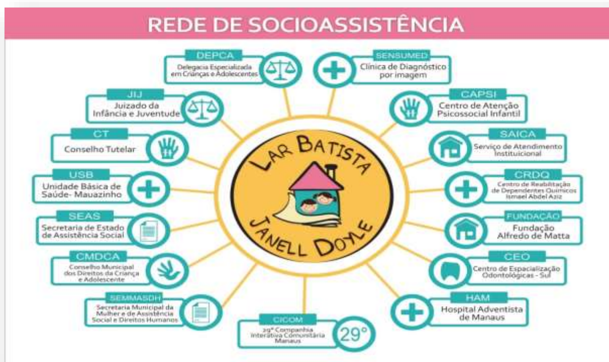
Figura 1 – Rede Socioassistencial do Serviço de Acolhimento Janell Doyle

funcionamento, contato e papel desempenhado, de modo a coordenar interesses distintos e fortalecer os que são comuns, assim, o Lar Batista Janell Doyle organizou um Banco de dados, com informações sobre cada serviço, de ordem governamental e não governamental e sobre o Sistema de Garantia de Direitos, e entre os encaminhamentos realizados, elencamos, como mostra a Figura 1, os serviços mais rotineiros, no que tange o acolhimento institucional, sendo que foi realizado um geoprocessamento que a entidade conta com um banco de dados atualizado, com endereço, contato e horário de atendimento de cada equipamento e serviço, demonstrado na figura abaixo: