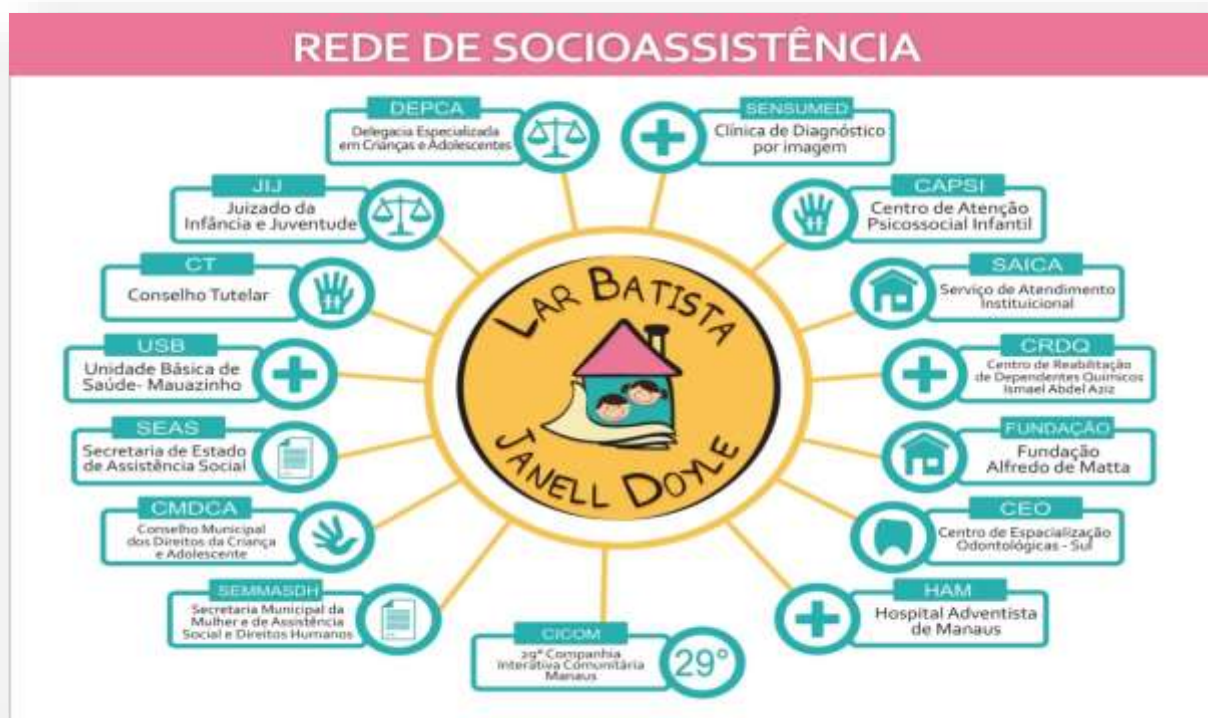
Figura 1 – Rede Socioassistencial do Serviço de Acolhimento Janell Doyle

funcionamento, contato e papel desempenhado, de modo a coordenar interesses distintos e fortalecer os que são comuns, assim, o Lar Batista Janell Doyle organizou um Banco de dados, com informações sobre cada serviço, de ordem governamental e não governamental e sobre o Sistema de Garantia de Direitos, e entre os encaminhamentos realizados, elencamos, como mostra a Figura 1, os serviços mais rotineiros, no que tange o acolhimento institucional, sendo que foi realizado um geoprocessamento que a entidade conta com um banco de dados atualizado, com endereço, contato e horário de atendimento de cada equipamento e serviço, demonstrado na figura abaixo: