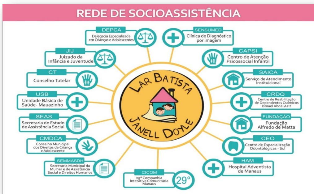
Figura 1 – Rede Socioassistencial do Serviço de Acolhimento Janell Doyle

Compreendendo que a articulação da rede socioassistencial viabiliza o acesso efetivo da população aos serviços, benefícios e projetos de assistência social, assim contribuindo para melhor eficiência e eficácia na realização dos Serviços oferecidos, realizamos o Levantamento Socioterritorial da área de abrangência de atuação do Lar Batista Janell Doyle, aonde mantemos articulação e conexões entre diferentes organizações, que consiste quanto ao funcionamento, contato e papel desempenhado, de modo a coordenar interesses distintos e fortalecer os que são comuns, assim, o Lar Batista Janell Doyle organizou um Banco de dados, com informações sobre cada serviço, de ordem governamental e não governamental e sobre o Sistema de Garantia de Direitos, e entre os encaminhamentos realizados, elencamos, como mostra a Figura 1, os serviços mais rotineiros, no que tange o Acolhimento em Família Acolhedora, sendo que foi realizado um geoprocessamento que a entidade conta com um banco de dados atualizado, com endereço, contato e horário de atendimento de cada equipamento e serviço, demonstrado na figura abaixo: